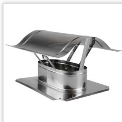
Daszek Fala. Zastosowanie: do zabezpieczenia przed wpływami atmosferycznymi kominów spalinowych i wentylacyjnych. Zalety: konstrukcja daszku nie zawęża przekroju przewodu kominowego; montowany bezpośrednio na płycie kominia ceramicznego stanowi jego estetyczne zakończenie. Podstawa [mm]: 320/395. Temperatura spalin: do 450°C. Gwarancja: 5 lat.