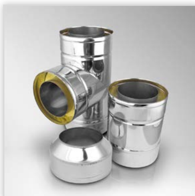
Komin izolowany typu SLIM. Zastosowanie: dwuścienny system kominowy z izolacją min. 30 mm do odprowadzania spalin z urządzeń grzewczych na gaz, olej i drewno, oraz do wentylacji. Zalety: wysoka jakość, tradycyjne rozwiązania w nowej odsłonie spełniające wymogi techniki kominowej. Średnica [mm]: 130-500. Temperatura spalin: do 450°C. Gwarancja: 5 lat.