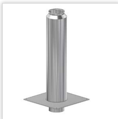
Przedłużenie izolowane kominia dymowego. Zastosowanie: do nadbudowania istniejących kominów ceramicznych; przedłużenie może być zabudowane do odprowadzania spalin z wszelkich urządzeń grzewczych atmosferycznych, spalających dostępne na rynku paliwa. Zalety: znacznie poprawia ciąg kominowy. Średnica [mm]: 150, 180, 200. Temperatura spalin: do 450°C. Gwarancja: 5 lat.