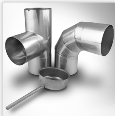
Wkład kominowy typu KF. Zastosowanie: jednościenny system kominowy do odprowadzania spalin z urządzeń grzewczych na gaz, olej i paliwa stałe. Zalety: łatwość montażu, wysoka trwałość i odporność na działanie kondensatu. Średnica [mm]: 100-500. Temperatura spalin: do 450°C. Gwarancja: 5 lat.