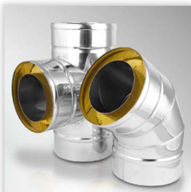
Komin izolowany typu KF. Zastosowanie: dwuścienny system kominowy z izolacją min. 50 mm do odprowadzania spalin z urządzeń grzewczych na gaz, olej i paliwa stałe. Zalety: najwyższa jakość, wytwarza dobry ciąg kominowy, odporny na wilgoć i działanie kondensatu. Średnica [mm]: 110-500. Temperatura spalin: do 450°C. Gwarancja: 5 lat.