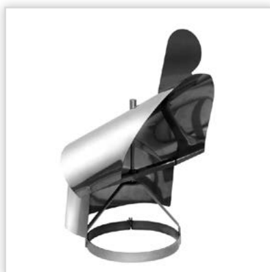
Oslona Strażak. Zastosowanie: jako element zakończenia kominia jest polecana przy przewodach spalinowych, dymowych oraz wentylacyjnych. Zalety: ustawiając się samoczynnie w odpowiedni sposób do wiejącego wiatru, przeciwdziała zawiewaniu, a specjalna budowa wspomaga zjawisko podciśnienia, poprawiając w ten sposób ciąg w kominie. Średnica [mm]: 150, 180, 200. Temperatura spalin: do 450°C. Gwarancja: 5 lat.