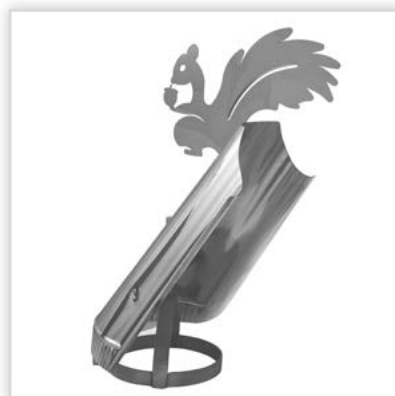
Oslona kominowa. Zastosowanie: zabezpieczenie przed wpływami atmosferycznymi kominów i przewodów spalinowych. Zalety: nie zawęża przekroju przewodu, ustawia się samoczynnie w odpowiedni sposób do wiejącego wiatru. Średnica [mm]: 150, 200. Temperatura spalin: do 450°C. Gwarancja: 5 lat.