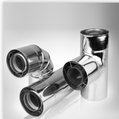
Nadciśnieniowy komin typu WSPS. Zastosowanie: współśrodkowy system kominowy do odprowadzania spalin z kotłów z zamkniętą komorą spalania – kondensacyjnych, jak i bez kondensacji oraz do dostarczenia potrzebnego powietrza do spalania. Zalety: wysoka trwałość i odporność na działanie kondensatu, połączenia mufowe zabezpieczone uszczelką gwarantującą szczelność systemu. Średnica [mm]: 60/100, 80/125, 100/150. Temperatura spalin: do 200°C. Gwarancja: 5 lat.