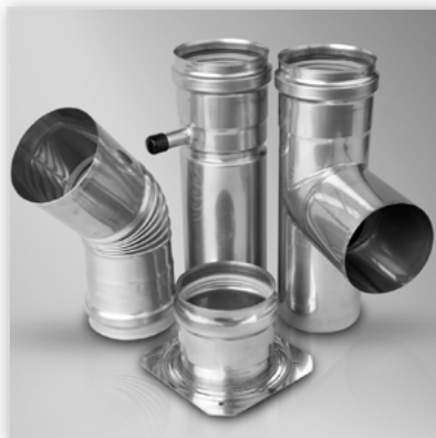
Nadciśnieniowy wkład kominowy typu SPS. Zastosowanie: jednościenny system kominowy do odprowadzania spalin z kotłów z zamkniętą komorą spalania, zarówno kondensacyjnych, jak i bez kondensacji. Zalety: wysoka trwałość i odporność na działanie kondensatu, połączenia mufowe zabezpieczone uszczelką gwarantującą szczelność systemu. Średnica [mm]: 60-300. Temperatura spalin: do 200°C. Gwarancja: 5 lat.